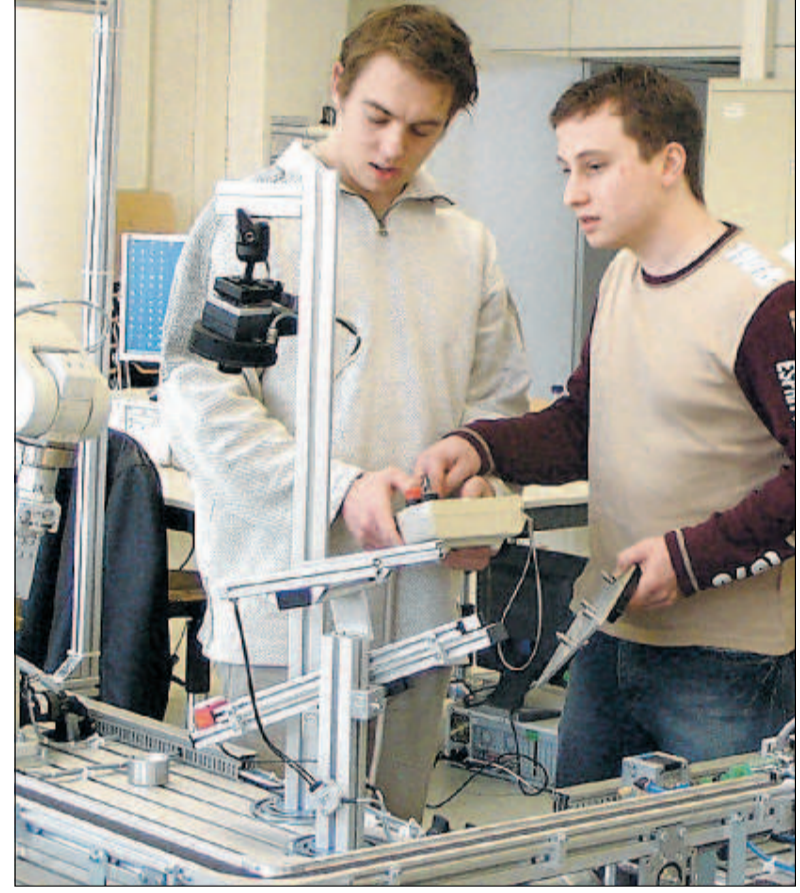
Die Fachhochschule Göppingen spielt im Bereich Mechatronik eine dominierende Rolle. Unser Bild zeigt Studenten bei Forschungsarbeiten.

www.kompetenznetzwerk.de www.mechatronik-ev.de