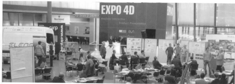
Ein Blick über die Arena: Die Aufgaben wurden dort quasi live auf der Motek eingebracht und von den Projekt-Teams vor Ort bearbeitet

Wirtschaftlicher Pflanzenschutz war das Ziel eines weiteren Projektteams. Statt in regelmäßigen Abständen sollen Pflanzen nur bei Bedarf gespritzt werden. Entsprechende Informationen können direkt aufs Handy geliefert werden – eine lauffähige Smartphone-App wurde vor Ort erstellt. Ein Sensor, der elektrische Signale an der