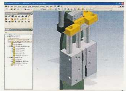
Ansicht einer 3D Konstruktion in Autodesk Inventor

Central Europe bei Autodesk bestätigt: „Wir sehen es als unsere gesellschaftliche Verpflichtung und als Investition in die Zukunft des Standortes Deutschland, den wissenschaftlichen Nachwuchs zu fördern. Durch unseren Beitrag wollen wir die Bedingungen für die jungen Nachwuchingenieure verbessern, so dass sie mit optimalen und zukunftsfähigen Werkzeugen arbeiten können.“